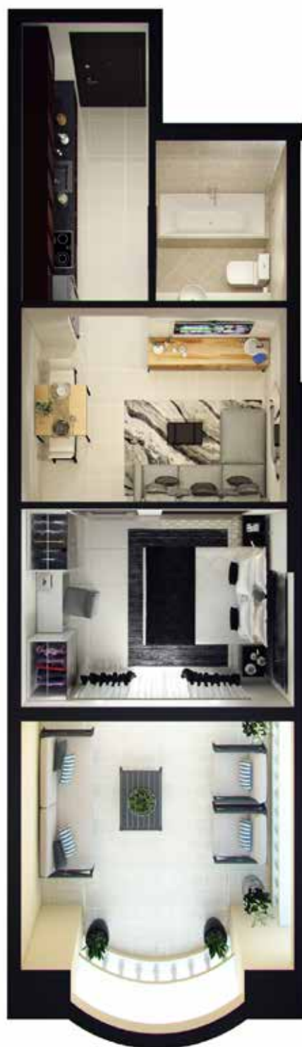
1 Bedroom Type-3