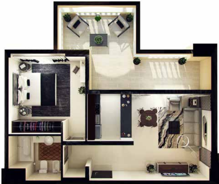
1 Bedroom Type-1