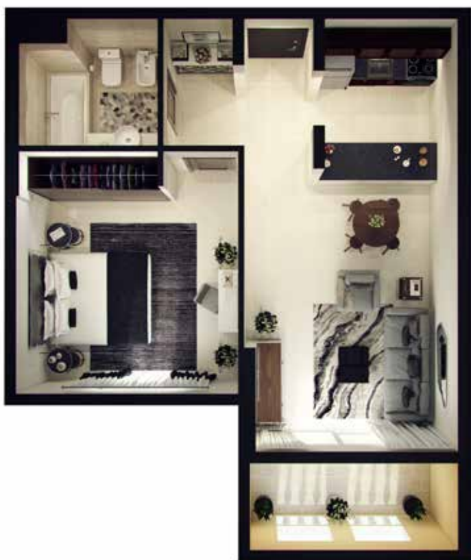
1 Bedroom Type-4